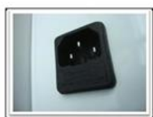
Base conexión con porta-fusible (1)