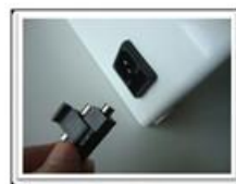
Sustituir fusible 1A. Existe un fusible de repuesto.