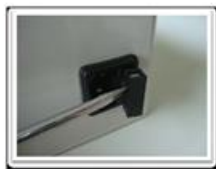
Con un destornillador o similar sacar la lengüeta del fusible.